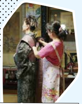
大島紬着付け体験