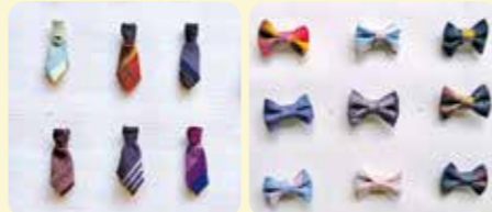
一点ものはその 都度変わる色柄 のラインナップ から好きなもの を選べる。

「ブートニエル」はフラン ス語で「ボタン穴」という意味 です。一般的にはスーツの左襟 のホールにつけるアクセサ リーなどを指しますが、「小 粋」はストールの留め具や シャツのブローチとしても、 自由に身につけていただけ た