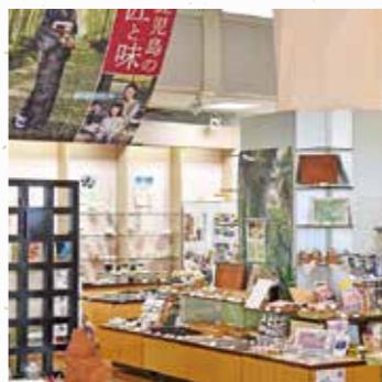
県産品総合展示販売場「鹿児島ブランドショップ」(県産業会館1階)