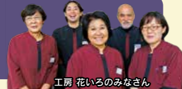
工房 花いろのみなさん