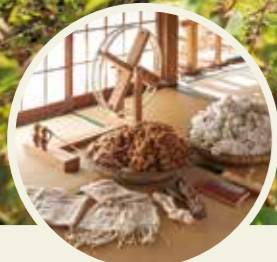
収穫した和綿と紡いだ 糸で織り上げた布