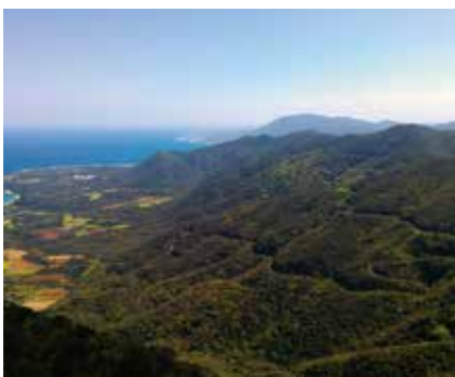
天城岳(徳之島)から望む景色

奄美群島は、温暖で降水量の多い気候で、常緑広葉樹の森が発達しており、多くの種類の生物の住みかとなっています。また、奄美群島は、約2億年前までにユーラシア大陸から切り離され、現在の島へと分かれたことから、大陸で絶滅した生物が奄美大島と徳之島では生き残り、独自の進化を遂げたものもいます。