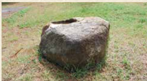
砲台跡近くには斉彬が使用したという取水鉢が残る