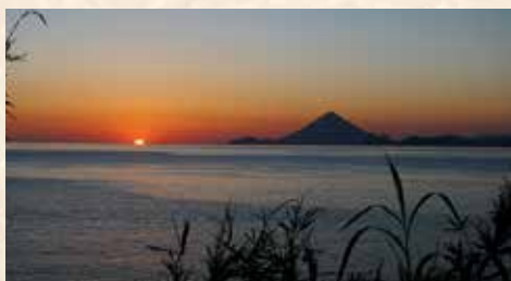
開聞岳を望める海側の景観