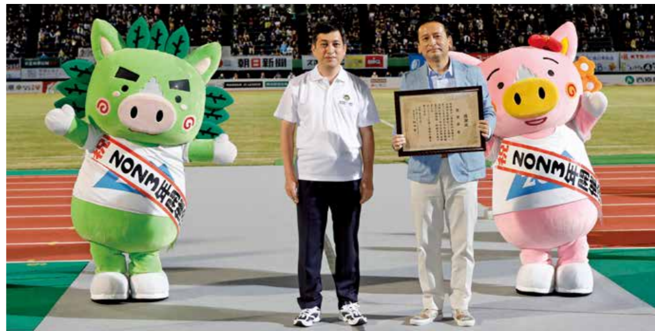
塩田知事から佐賀県の山口知事(写真右)への感謝状贈呈の様子