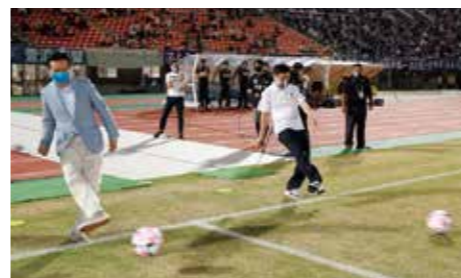
両県知事によるキックインセレモニーの様子