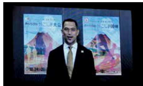
室伏スポーツ庁長官からの祝いメッセージの紹介