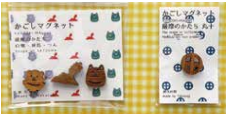
包装もかわいらしくお土産や贈り物として人気。袋を開けると優しい屋久杉の香りが漂う

使っている素材は、屋久島に自生する樹齢千年を超える希少な屋久杉です。屋久杉は年輪の詰まった複雑な木目をしてるのが特徴で、このマグネットのサイズでもその美しさを感じることがができます。