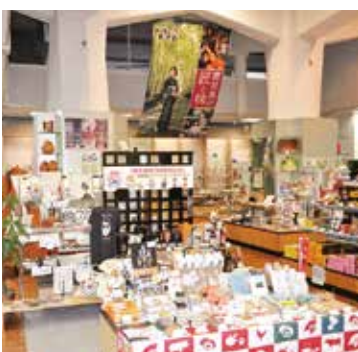
県産品総合展示販売場「鹿児島ブランドショップ」(県産業会館1階)