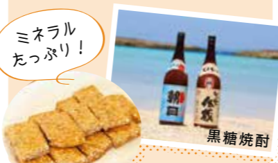
◀ゴマと黒糖のお菓子