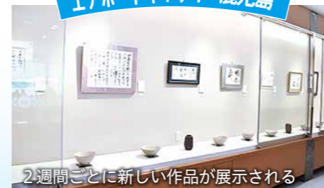
2週間ごとに新しい作品が展示される