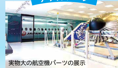
実物大の航空機パーツの展示