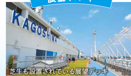
芝生も設置されている展望デッキ