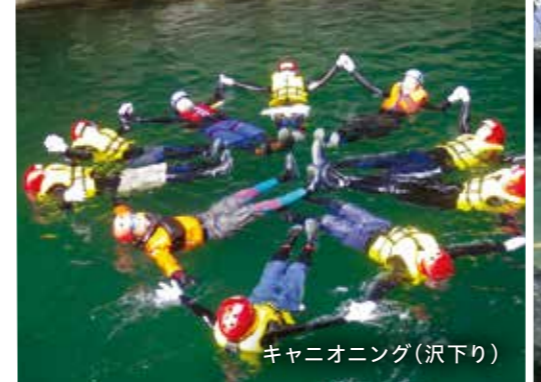
キャニオニング(沢下り)

所 垂水市浜平 2058-3 問 マリナパーク垂水 ☎ 0994-45-7182 交 垂水港から車で約 5 分