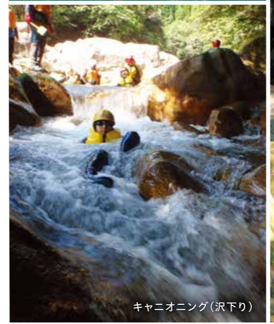
キャニオニング(沢下り)