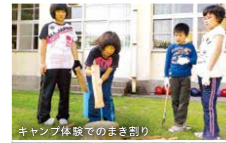
キャンプ体験でのまき割り