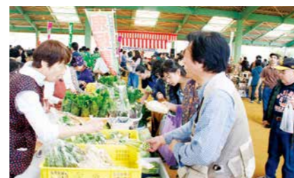
屋久島町役場本庁舎周辺

問い合わせ 屋久島町ふるさと産業祭り実行委員会事務局 Tel. 0997-43-5900