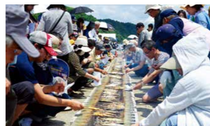
さつま町 二渡水辺公園