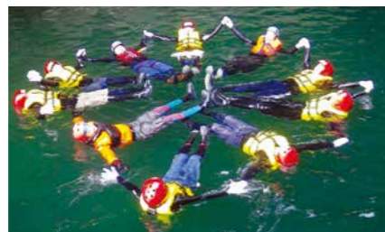
垂水市 猿ヶ城渓谷