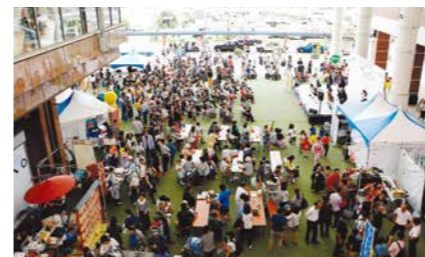
鹿児島市 アミュ広場および周辺商店街ほか

問い合わせ 鹿児島中央駅東口地区連絡協議会 Tel. 090-9070-4068