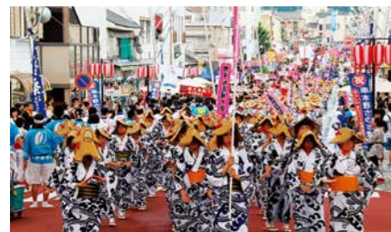
いちき串木野市 中心商店街