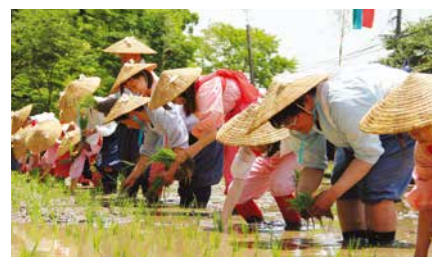
霧島市 鹿児島神宮