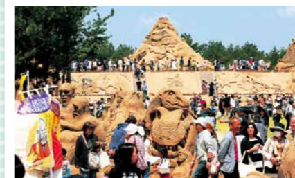
南さつま市 砂丘の杜きんぼう内特設会場

問い合わせ 吹上浜砂の祭典実行委員会(南さつま市役所内) Tel. 0993-76-1609