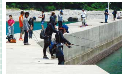
薩摩川内市 上甌島および中甌島

問い合わせ 甌島イカ祭り大会実行委員会事務局(上甌島観光案内所内) Tel. 09969-6-3930