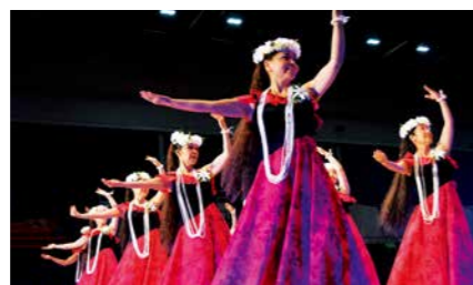
指宿市 指宿総合体育館

問い合わせ いぶすきアロハのまちづくり推進運動実行委員会(指宿市観光協会内) Tel. 0993-22-3252