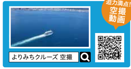
よりみちクルーズ 空撮