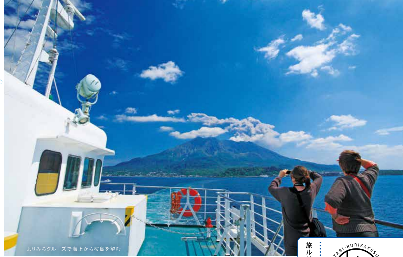
よりみちクルーズで海上から桜島を望む

所 鹿児島市 問 かごしまカヤックス ☎ 090-4583-6920 ※料金等は時間・コースにより異なります ※コースにより集合場所が異なります