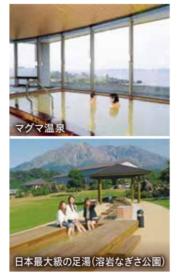
日本最大級の足湯(溶岩なぎさ公園)

【料金】 マグマ温泉(日帰り): 大人 390円 / 子ども 150円 溶岩なぎさ公園足湯: 無料