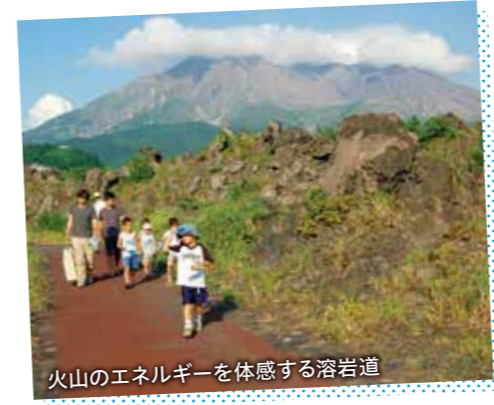
火山のエネルギーを体感する溶岩道