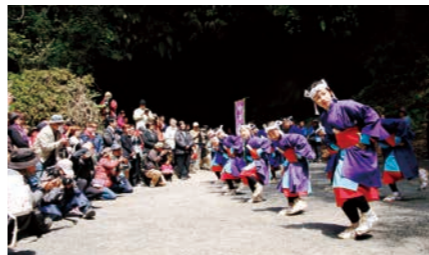
曾於市 溝ノ口洞穴(県天然記念物指定)