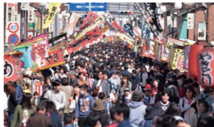
出水市 高尾野駅前中心部商店街

問い合わせ 高尾野「中の市」実行委員会(鶴の町商工会本所内) Tel. 0996-82-1065