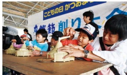
枕崎市 南薩地域地場産業振興センター周辺