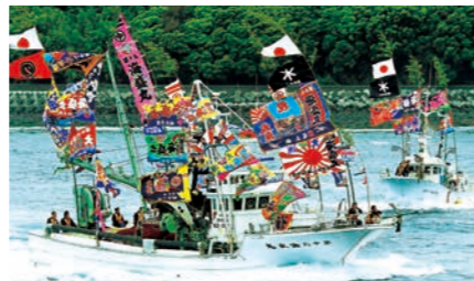
阿久根市 北さつま漁協黒之浜支所周辺