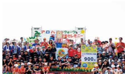
指宿市 ふれあいプラザなのはな館

問い合わせ いぶすまアロハのまちづくり推進運動実行委員会(指宿市観光協会内) Tel. 0993-22-3252