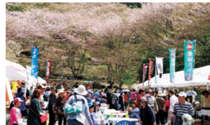
いちき串木野市 観音ヶ池市民の森