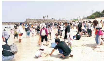
天城町 ヨナマビーチ