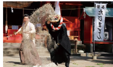
日置市 大汝牟運神社境内