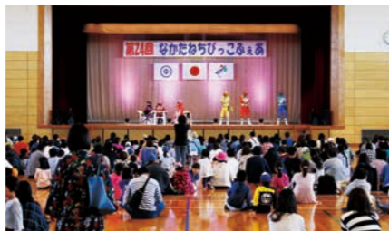
中種子町 種子島中央体育館