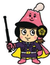
さくらロールちゃん