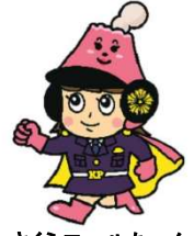
さくらロールちゃん