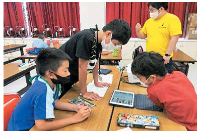
インリーダー研修(デジタルワークキャンプ)

青少年教育の充実、振興の一環として、小中学生を対象に、「トワイライト研修」と「インリーダー研修」とを隔年ごとに行っています。異年齢による学習活動・自然体験や、県内外で宿泊を伴った体験活動を通して、子ども会や地域活動においてリーダーシップを発揮できる子どもの育成を目指しています。