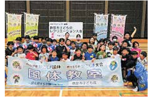
子ども会活動の様子

鹿屋市では、「地域の子どもは地域で育てる」環境の充実に取り組んでいます。特に子ども会での活動体験は、地域づくり・人づくりの観点からも欠くことのできない重要なもので、子どもの健全育成に大変有意義であることから、市内の子どもたち全員の子ども会参加(100%加入)をめざしています。そのために、市子連・市P連・校長会・教頭会・町内会・スポーツ少年団の各代表による活性化推進委員会を設け、鹿屋の子どもたち全員に豊かな体験を味わわせようと取り組んでいます。