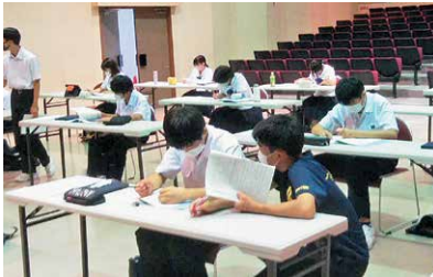
学習に取り組む中学生

本年度は自学自習形式を取り入れ、かごしま学力向上支援 Web システム掲載問題に取り組みました。指導者に鹿児島大学の学生や地元の高校生ボランティアの協力もいただき実施することができました。