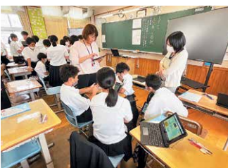
垂水中央中学校の公開授業

今年度は、文部科学省の「リーディングDXスクール事業」に採択され、垂水中央中学校と垂水小学校を推進拠点として、学校における実践研究や研究公開等を行っています。この事業への取組を通して、1人1台端末とクラウド環境を活用した効果的な教育実践の創出とモデル化を目指します。