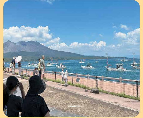
(垂水市 夏の晴天と船団パレード)