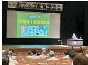
志アップ教育講演会

教員の指導力・生徒指導力等の向上のために、教育センター研究主事による講義、演習（模擬授業）の研修、県内外で活躍されている方の教育講演会「志アップサマープロジェクト」を開催しています。