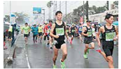
(生涯スポーツの推進)

生涯スポーツの一環として、バレーボールやソフトボールなどの各種大会を実施するなど、スポーツ活動を推進しています。また、今年度は、4年ぶりに「内之浦銀河マラソン」を実施します。例年、町内外から小学生から60才代まで1,000人を超えるランナーが参加しており、決められた距離ごとに、タイムを競い合っています。様々なスポーツ活動を通して、幅広いスポーツの普及と健康増進及び体力の向上を目指し、取り組んでいます。