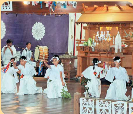
(志布志市 「島の民俗無形文化財 田之浦夜神楽(子供神楽)」)