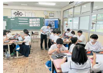
【タブレットを活用した授業】

令和3年度から、一人1台タブレットを活用した学習を始めました。シンキングツールを使って自分の考えをまとめたり、お互いの考えを交流したりと、様々な場面での活用が期待できます。