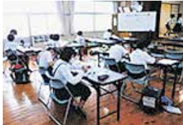
鹿屋寺子屋「寿北ランラン塾」

平成28年度にスタートした鹿屋寺子屋は、生涯学習の拠点施設である公民館を中心に、現在31カ所開設され、450人以上の子どもたちが塾生として参加しています。原則学習活動は週1回、体験活動は月1回と位置付けており、それぞれの実情に合わせた開講日が設定され、地域の方々との学習活動や体験活動をとおして、子どもたちは学び合う楽しさや郷土愛を育み、異年齢交流をとおした地域の絆を深めています。今後も「地域の子どもは地域で育てる」理念のもと、地域型寺子屋の充実・拡充に取り組んでまいります。