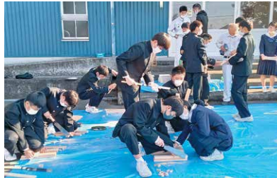
環境の授業の様子

現在、体験型のプログラムから探究活動に広げる学習を、全ての小・中学校で進めています。