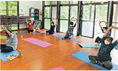
(生涯学習環境の充実)

町内にある11の各地区公民館等では、町民のニーズや現代的課題等に対応した学習の機会の充実を図っています。その1つとして、地域住民の学習機会の確保や活力の維持向上を目的とした生涯学習講座を開設し、料理やクレイフラワーなどの制作活動やヨガ、体操などの体験活動、今日的課題であるパソコン活用など、多岐に渡る講座を実施することにより、地域住民のウェルビーイングを推進しています。