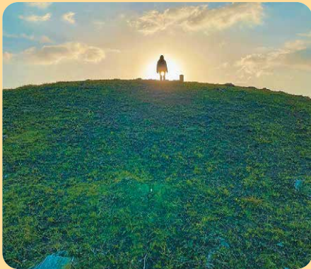
(東串良町 唐仁古墳)