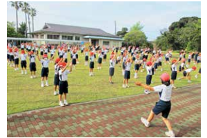
「Exseed」に取り組む小学生

体力・運動能力向上を目指して鹿屋体育大学との連携を進めています。平成28年度からは、スポーツトレーニング教育研究センター協力校を指定し、大学が考案した運動プログラム「Exseed」を、授業に取り入れ、健康・体力づくりの充実を図っています。また、教育実習生を受け入れたり、学校応援団やスポーツボランティアとして協力をもらったりして、授業等における技術的な指導や、学校行事等でのサポートを受けています。このような取組は学生にとっても、指導の機会を得られる貴重な学びの場となっています。