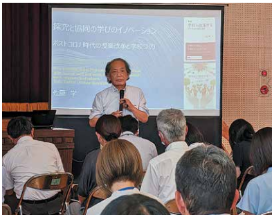
【市「豊かな学び」研修会】

個別最適で協動的な学びの実現を合言葉に、「個に応じた指導」「学び合いのある授業」の実践、校内研修を推進しています。ICT機器の活用や、学校活動支援員の配置等により、「主体的・対話的で深い学び」の授業実践に努め、思考力・判断力・表現力等の育成をめざしています。