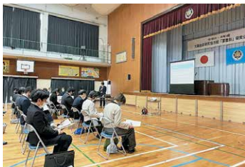
【池之原小学校研究公開】

21世紀をたくましく生きる個性豊かな児童生徒の育成を2小1中の共通の目標に掲げ、9か年の学習内容の系統を踏まえながら「主体的・対話的で深い学び」の実現を目指して自分で考える授業の展開に努めています。