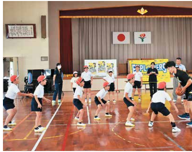
【体力向上へ向けた取組】

子どもたちの規範意識の醸成や豊かな人間性の育成に向け、道徳教育の充実や積極的生徒指導に取り組んでいます。教育相談・連携支援体制も整備が進みました。また、「一校一運動」の推進による体力・運動能力の向上や、健康教育の推進にも積極的に取り組んでいます。