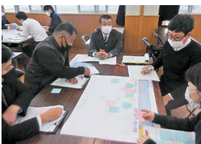
根占中 子どもの姿に着目した授業研究

町内全小中学校が連携して、「学習者主体の授業づくり」の実現に向け、授業改善や教師の資質向上に努めています。他校の研究授業にも積極的に参加し、校内研修に子どもの姿に着目した授業研究を取り入れ、児童生徒の学力向上と教師の授業力向上を目指しています。