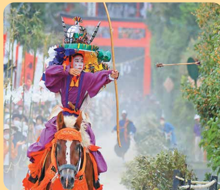
(肝付町 四十九所神社の流鏝馬)