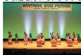
「ANYTHING GOES! フェス2023 ~なんでん やってみっが!見け行っが!~

児童生徒が、日頃から練習している特技や趣味、伝統芸能などを披露・発表・交流する場を設定し、自己有用感を高める取組を行っています。また、全小・中学校の保護者に「志アップ子育て手帳」を配布し、PTA等で活用することで学校・家庭・地域が連携し、家庭教育向上に努めています。