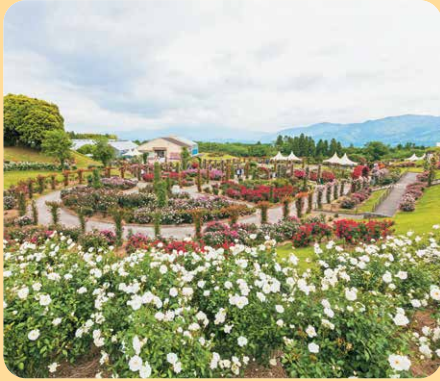
(鹿屋市 かのやばら園)