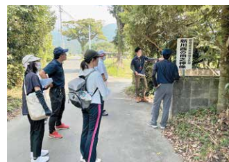
【講師の説明を聞く教職員】

新しく本町に赴任された教職員を対象に、毎年夏季休業中に実施しています。国指定の「唐仁古墳群」をはじめ、多くの文化財に直接触れることで、町の歴史を体感し、郷土教育の実践に活かしています。