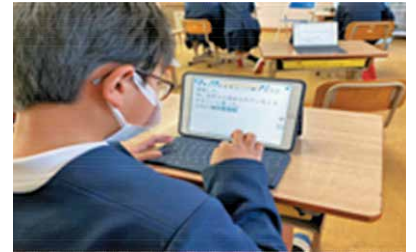
タブレットを使った授業の様子

デジタルの力で、誰もが大崎町に住んで良かったと実感していただけるよう、目標を掲げ、「デジタルでつかむ・しあわせあふれる未来」を目指すことを宣言しています。