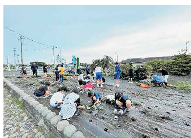
根占交番付近での花植え作業

毎月第3土曜日を「南端まちづくり活動」の日とし、地域住民や青少年と一緒に美化活動を行っています。まちをきれいにするとともに、青少年の健全育成を図ることを目的に、花壇の花の植え付けや除草作業、公園の清掃活動をしています。