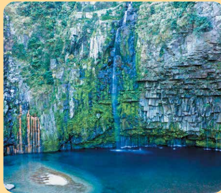
(南大隅町 雄川の滝)