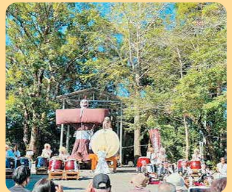
(曾於市 大隅弥五郎どん祭り)