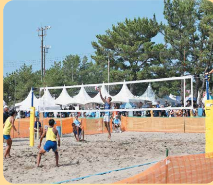
(大崎町 ビーチスポーツ専用競技場)