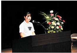
受賞者による朗読

多くの若者が特攻隊員として飛び立った鹿屋の地から、「平和へのメッセージ」を世界に向けて発信し、平和や人権について考えるという趣旨のもと、かのや未来創造プログラム「平和の花束」事業に取り組んでいます。10周年を迎える令和5年度は、県内外の小・中・高校生から6千点を超える「平和へのメッセージ」の応募があり、セレモニーでは、受賞者朗読、表彰、講演会等を行い、その後は、ラジオ放送、記念誌作成まで行っています。令和3年度からは英語部門も新設し、令和4年度からは台湾からも作品が寄せられるなど、年々、取組が広がりを見せています。