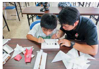
標本づくりの様子

「植物」「昆虫」「貝」「岩石」の講座を、それぞれ大野自然学校や猿ヶ城溪谷、荒崎海岸などを採集場所・標本づくり会場にして、親子で楽しめるようにしています。垂水市の自然を新たに見つめ直す機会となり、親子で活動に没頭する姿が見られました。