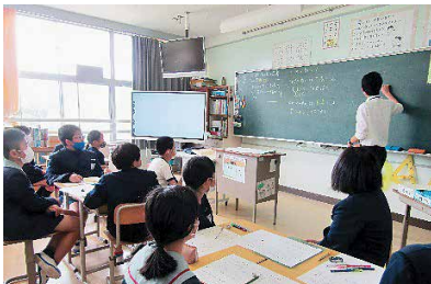
中学校教員による小学校での算数の授業

町内の学校では、2つの中学校区ごとに施設分離型小中一貫教育に取り組んでいます。「義務教育9年間の教育」を見据え、学力向上や生徒指導の充実を図り、児童生徒の交流学習や教職員の相互研修などに取り組んでいます。また、地域学校協働活動や学校運営協議会なども取り入れ、地域と一体となって子どもたちを育む教育に取り組んでいます。