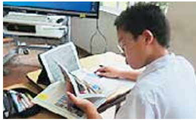
(確かな学力の育成)

内之浦小学校では、総合的な学習の時間に、内之浦宇宙空間観測所やロケットについての調べ学習、現地での見学学習、JAXA職員を招聘して、ペットボトルロケットや傘袋ロケットの製作・発射体験等の探究活動を通して学習の基盤となる資質・能力の育成を図っています。また、内之浦中学校では、探究活動の一環として、JAXAの開発担当者の話を聞いたり、近隣中学校との遠隔合同学習を実施したりすることで、学習の基盤となる資質・能力の育成を図っています。