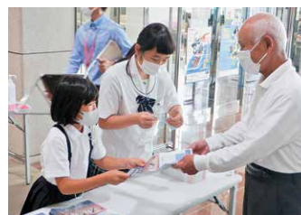
コンサートでの受付

垂水おもてなし少女・少年隊には、小学生から高校生まで、合計24人が所属しています。ボランティア活動等を通して、おもてなしの心を持ち、自分から進んで物事に取り組む姿勢や思いやりの心を育むことが目的です。コンサートでの席内や国体会場での受付等で活躍しました。