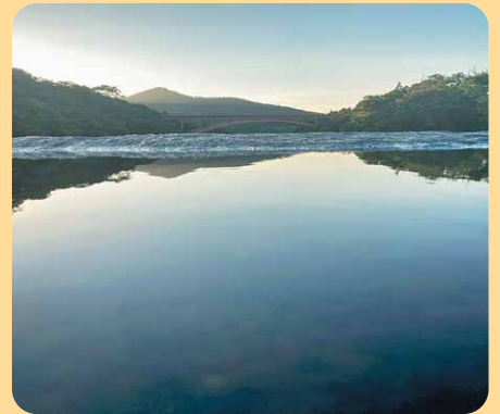
(錦江町 花瀬川から眺める夕日の小波)