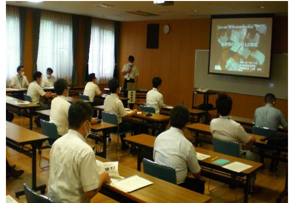
実践発表「出水市の学力向上の取組」