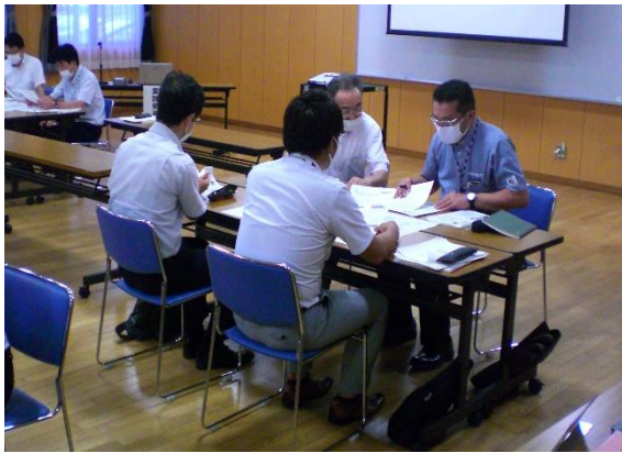
グループ協議の様子