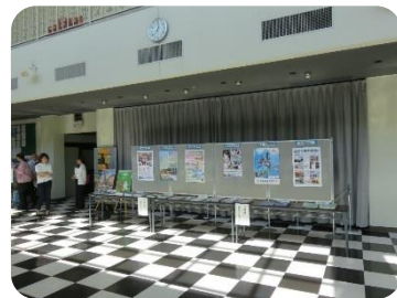
出水地区内高等学校，特別支援学校の ポスター，パンフレット等展示