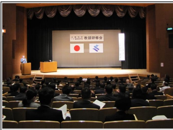
閉会の挨拶 阿久根市教育委員会 中野正弘教育長