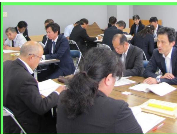
分科会(グループ協議) 小学校 業務改善