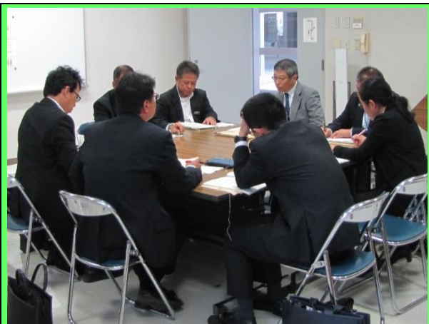
分科会(グループ協議) 中学校 生徒指導