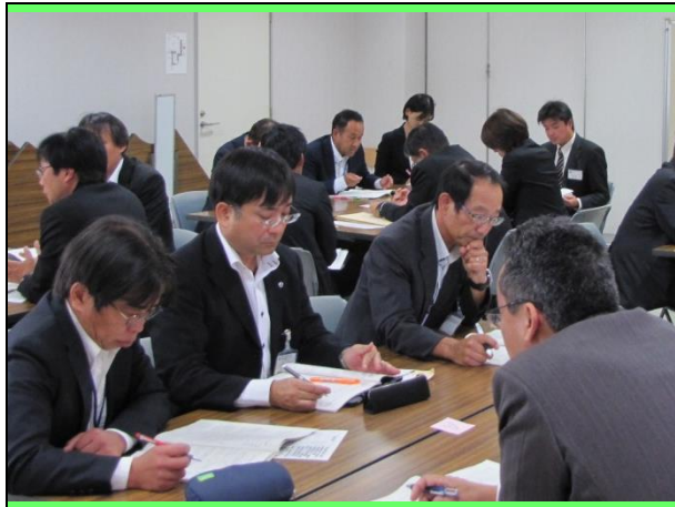
分科会(グループ協議) 小学校 生徒指導②