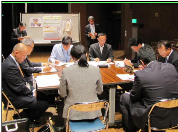
分科会(グループ協議) 中学校 業務改善