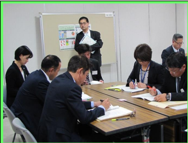
分科会(グループ協議) 小学校 生徒指導①