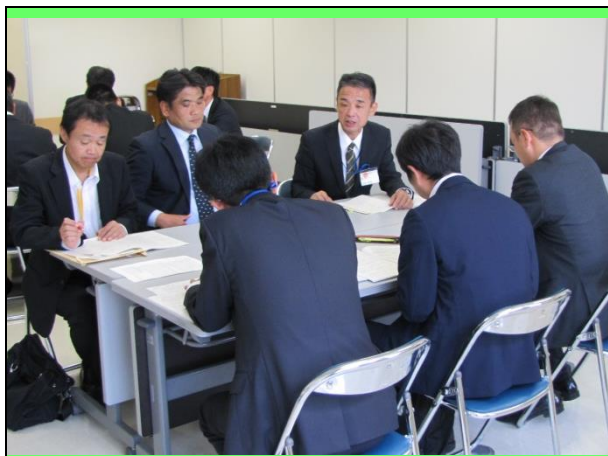
分科会(グループ協議) 中学校 学力向上