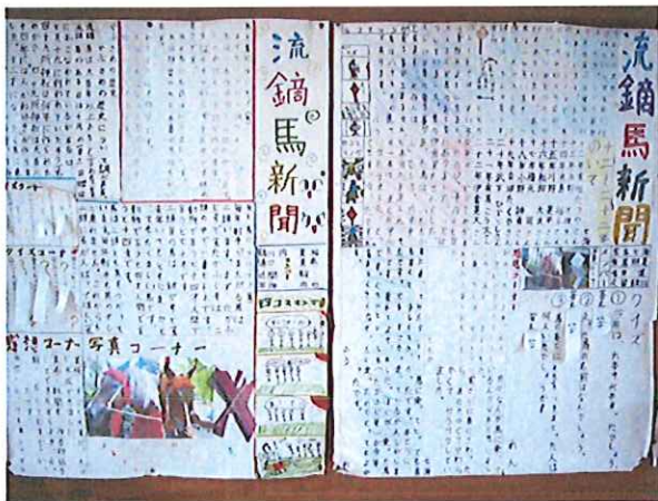
学習発表会での展示発表