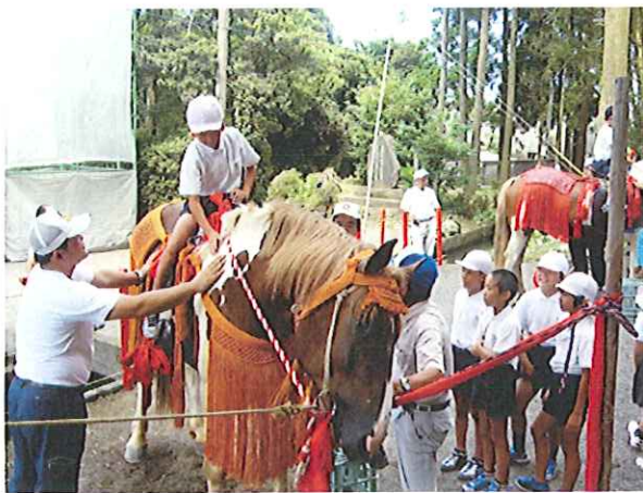
流鏝馬で実際に走る馬に乗る児童たち