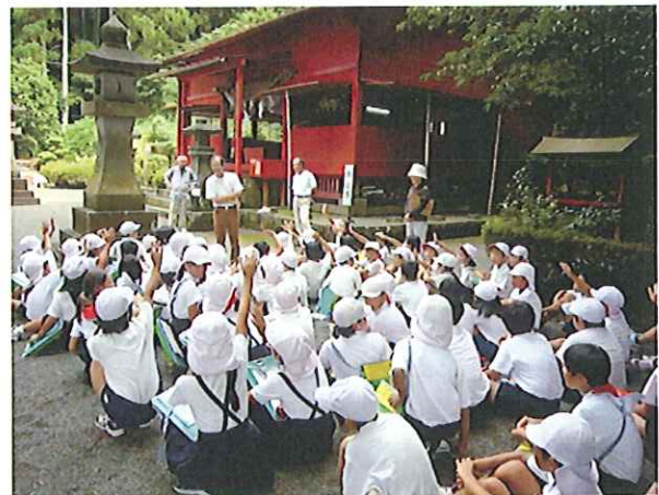
保存会による講話