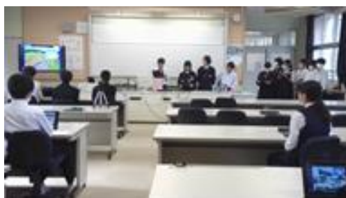
【研究発表】 （リモートにて各学級へ配信）