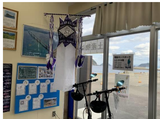
里港ターミナルでの展示発表