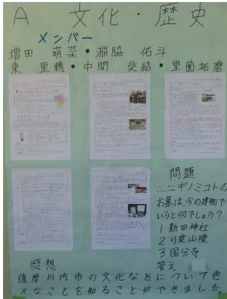
〔調べた内容をまとめた壁新聞〕