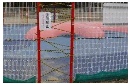
立入禁止措置状況