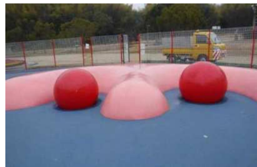
ボール（φ850）設置時の状況