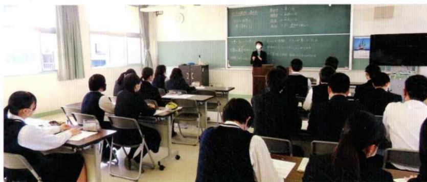
ビジネスマナー指導