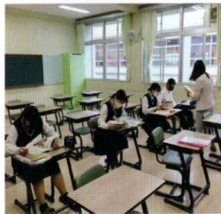
進路希望別ガイダンス