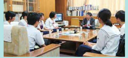
農林水産省官房長室にて

同窓会（龍門会）支部のある国内の都市において、大学や企業・官公庁等の見学などの研修を行い、進路への意識や学力の向上に繋がります。また、同窓生と交流することで、同窓会支部との絆を深め、進学・就職した際に同窓生を相談相手とするきっかけを作ります。令和元年度は関東龍門会の協力のもと、6名の生徒がソニー生命保険株式会社や農林水産省、大学のオープンキャンパス等の見学を行いました。（R5年度は実施の予定）