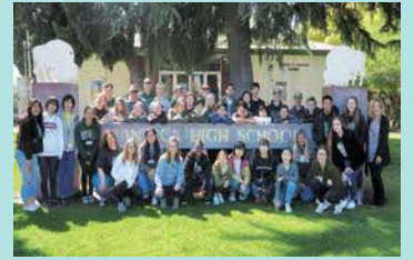
マンティカハイスクールにて現地の高校生と(第3回海外短期研修・H31春)

世界のボーダレス化・グローバル化が進む中、多様な考え方のできる人材が求められています。海外短期研修では、異文化を体験し、外国の同世代の若人と交流することで、異なる文化を理解し、尊重する態度を身につけ、将来グローバルな視点をもって活躍できる人材育成を目指しています。毎年、2年生10名がアメリカ西海岸に2週間ほど滞在し、ホームステイをしながら現地高校への体験入学や大学・企業等の見学を行っています。（R5年度は実施の予定）