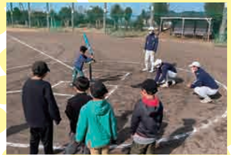
ティーボール教室