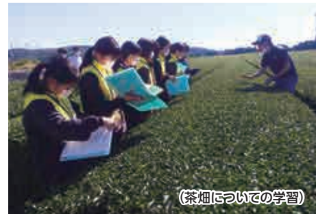
(茶畑についての学習)