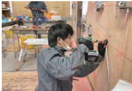
6月 ものづくりコンテスト県大会