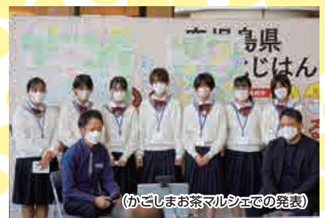
総合的な探究の時間