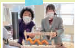
▶パテントコンテスト優秀賞 「らくらくシャンプー・リンス 詰め替え装置」