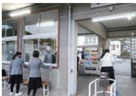
清掃ボランティア