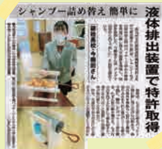
▲液体排出装置で特許取得 (新聞記事) 南日本新聞令和4年12月6日