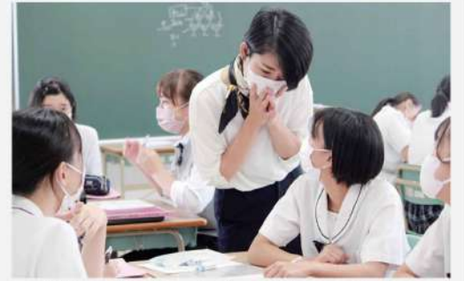
「総合選択制」自由に選択 OK だよ!