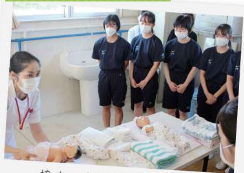
協力：鹿屋看護専門学校