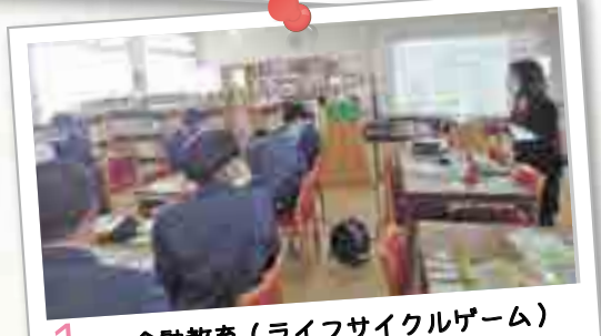
1月 金融教育(ライフサイクルゲーム)