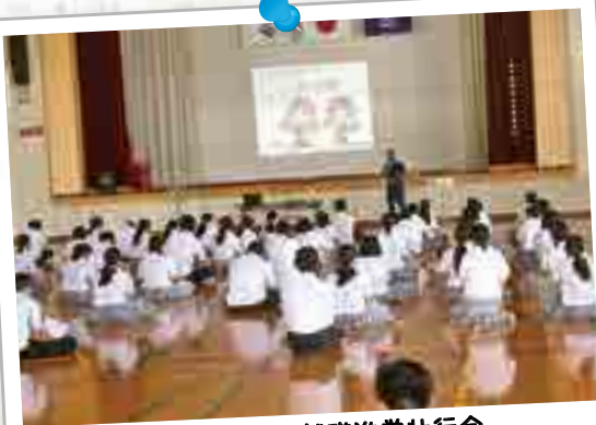
9月 3年面接練習 就職進学壮行会 インターンシップ 進路ガイダンス 人権同和教育講演会