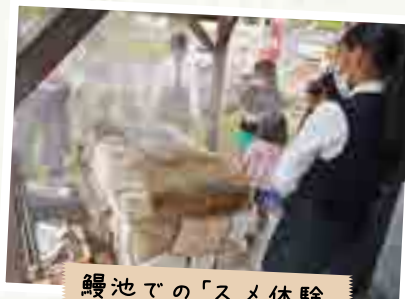
鰻池での「スメ体験」