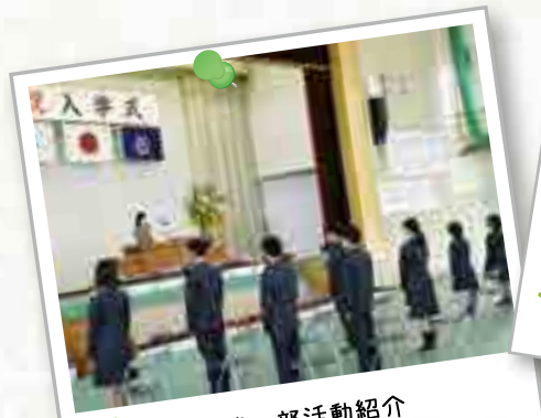
4月 入学式 部活動紹介