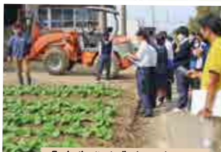
県内先進的農家視察研修