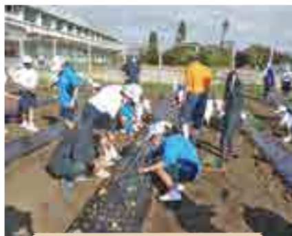
山川中学校にて出前授業