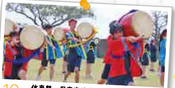
10月 体育祭・保育交流会 防災避難訓練 折鶴配布運動