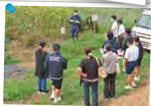
8月 中学生体験入学