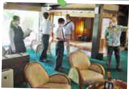
6月 指宿魅力発見 Job ツアー