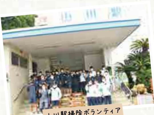
山川駅掃除ボランティア