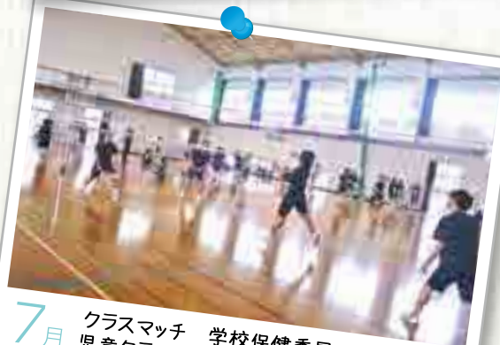
7月 クラスマッチ 学校保健委員会 児童クラブとの交流会