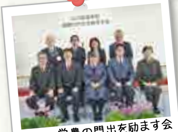
2月 営農の門出を励ます会 針供養 同窓会入会式