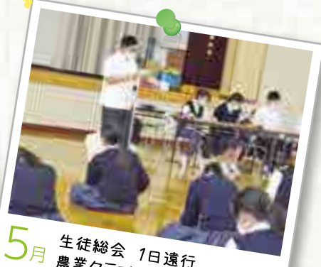
5月 生徒総会 1日遠行 農業クラブ・家庭クラブ総会 折鶴配布運動