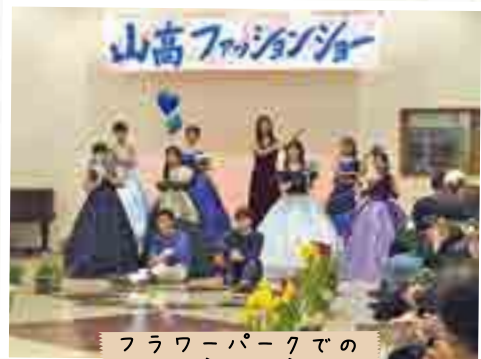
フラワーパークでの ファッションショー