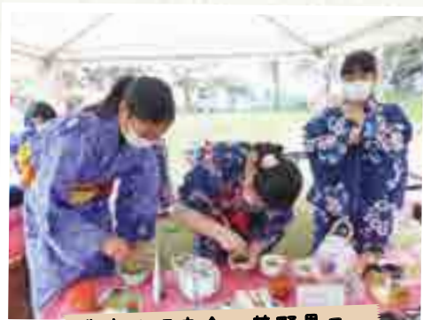
農産物販売会・花野果フェ