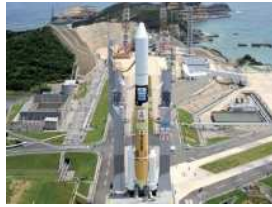
種子島宇宙センター