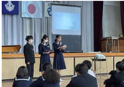
絵本「いじめているきみへ」朗読