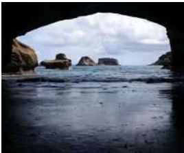
千座(ちくら)の岩屋