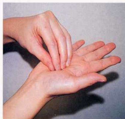
3. 指先、爪の間をよく洗う