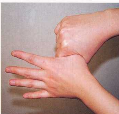
5. 親指と手掌をねじり洗いする