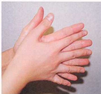
1. 手のひらを合わせ、よく洗う