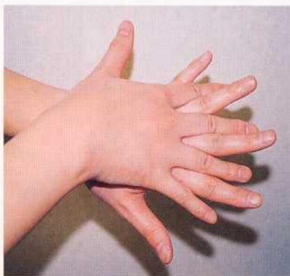
2. 手の甲を伸ばすように洗う