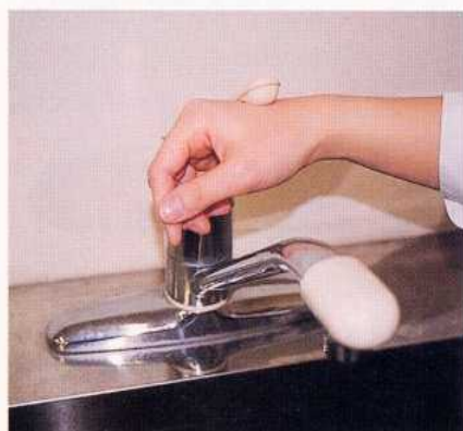
7. 水道の栓を止めるときは、手首か肘で止める。できないときは、ペーパータオルを使用して止める