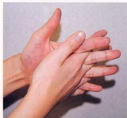
4. 指の間を十分に洗う