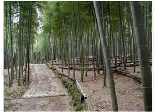
改良竹林（路網開設）