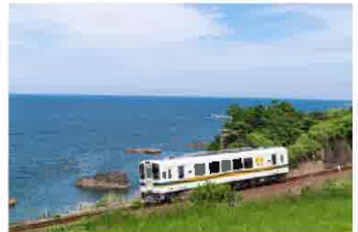
肥薩おれんじ鉄道