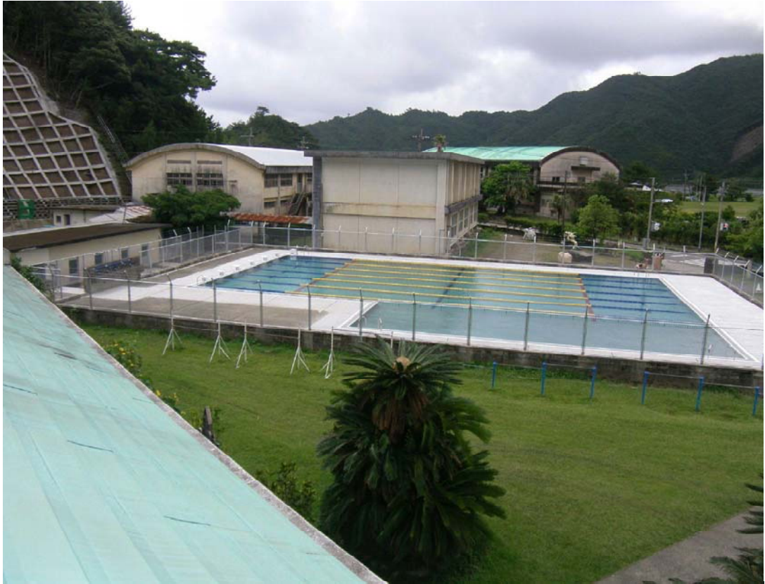
復旧状況（東城小中学校プール）