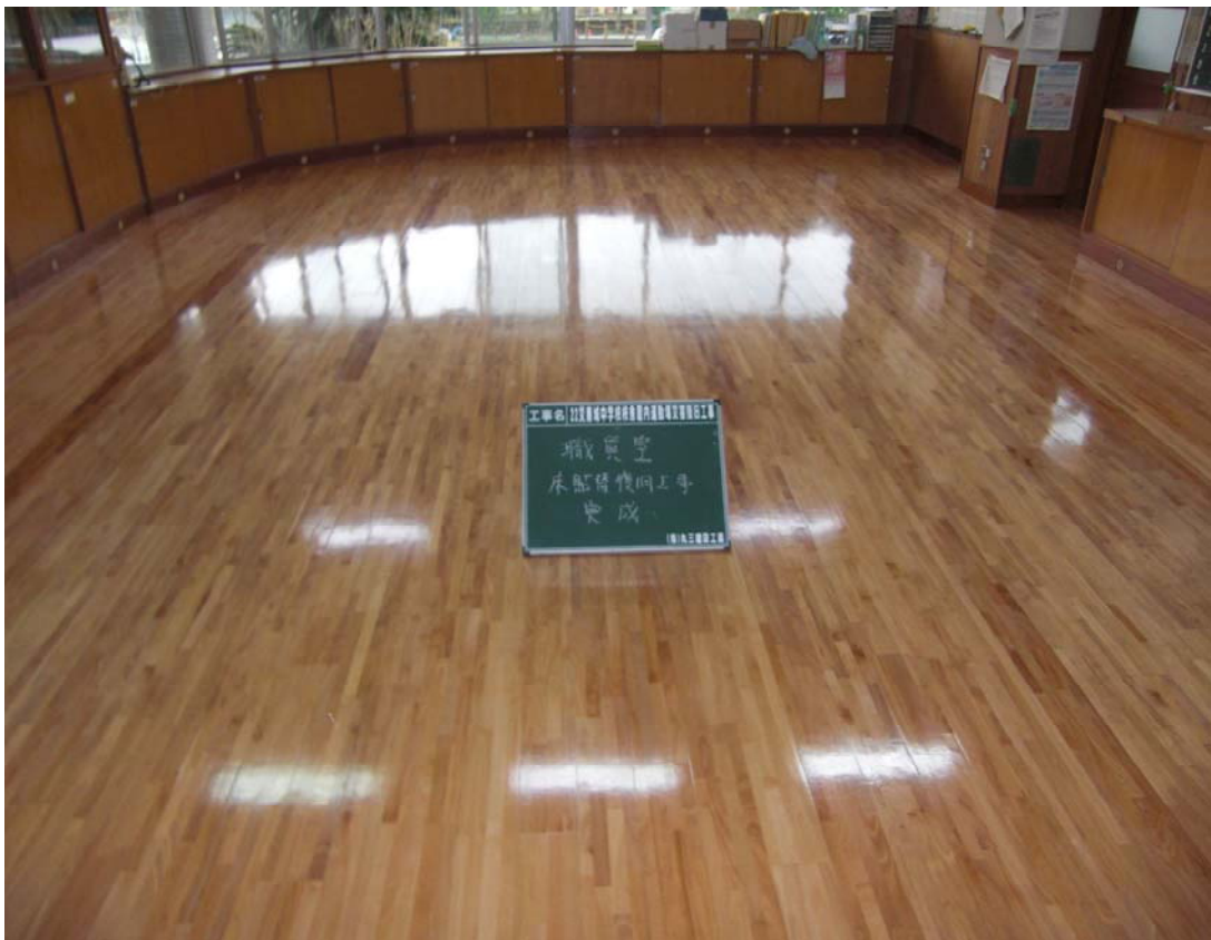
復旧状況（東城小中学校職員室）