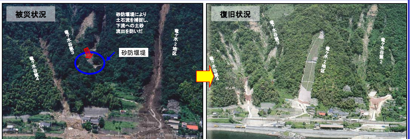
平成5年鹿児島豪雨災害時の竜ヶ水地区の被害状況と復旧状況