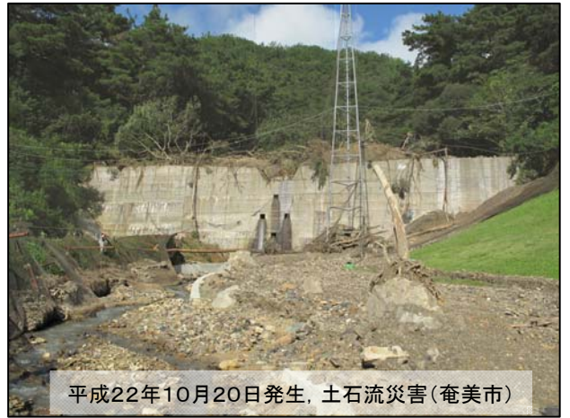
平成22年10月20日発生、土石流災害(奄美市)

今、奄美大島は復興するために、たくさんの場所で行われています。みんな復興目指してがんばっているのだから、僕は僕にできることをこれからも積極的にいき、奄美大島が一日でも早く、もともとのきれいな海や山などの自然でいっぱいの奄美大島に戻ってほしいです。