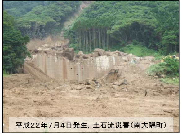
平成22年7月4日発生、土石流災害(南大隅町)

ぼくは、一年前に土砂くずれにいました。その土砂くずれは、大雨が続き起きたものです。土砂くずれが起きた日、僕は目をうたがいました。実は、四年前にも台風のえいきょうで土砂くずれを経験していましたが、それ以上に大きくずれていたからです。