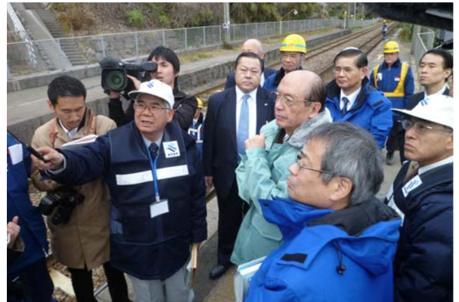
鹿児島地域振興局宇都博美建設部長から説明を受ける前田武志国土交通大臣