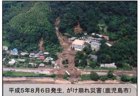
平成5年8月6日発生、がけ崩れ災害(鹿児島市)

私の祖父は吉野町の花倉に住んでいます。祖父宅の裏山から錦江湾を見下すと雄大な桜島がみえ、絶好のロケーションです。