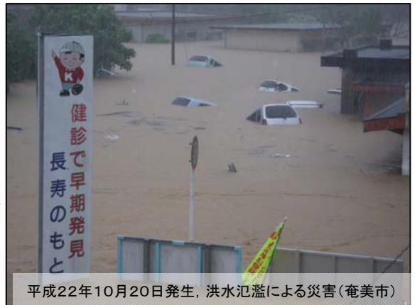
平成22年10月20日発生、洪水氾濫による災害(奄美市)

きょねんの十がつはつか、わたしのすんでいる住用町に大あめがふりました。わたしは、そのときほいくしよのねんちようぐみでした。そのひは、あさから、ずっとあめがふっていました。ひるのこのはんのあと、あそんでいると、いり口のかいだんの二だんめに、どしゃがながれてきていました。わたしは、びっくりして、せんせいにしえにははっていききました。