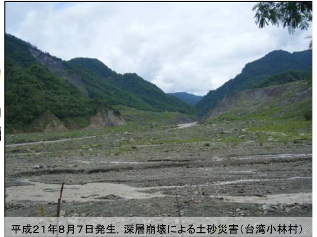
平成21年8月7日発生、深層崩壊による土砂災害(台湾小林村)

そうしたことをすることで、開発途上の国は発展し、もっと平和で豊かな世界をつくることができるのではないかと。