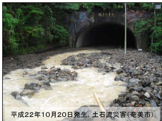
平成22年10月20日発生、土石流災害(奄美市)

この美しい島、奄美大島の復興には少し時間がかかると思う。でも、災害に負けないような心を奄美の人は持っている。これからも協力し合って生活していきたいと思う。