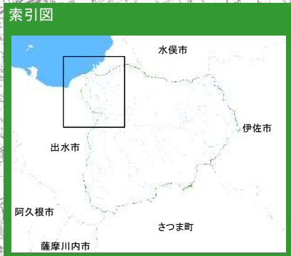
米之津川水系米之津川洪水浸水想定区域図 【家屋倒壊等氾濫想定区域（河岸侵食）】