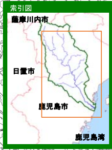
甲突川水系甲突川 【家屋倒壊等氾濫想定区域(氾濫流)】

1 説明文 (1) この図は、甲突川水系甲突川の水位周知区間について、家屋倒壊等をもたらすような氾濫の発生が想定される区域(家屋倒壊等氾濫想定区域)を表示した図面です。 (2) この家屋倒壊等氾濫想定区域は、公表時点の甲突川の河道の整備状況を勘案して、想定し得る最大規模の降雨に伴う洪水により甲突川が氾濫した場合の氾濫流の状況をシミュレーションにより予測したものです。 (3) なお、このシミュレーションの実施にあたっては、支川の決壊による氾濫、シミュレーションの前提となる降雨を超える規模の降雨による氾濫、高潮及び内水による氾濫等を考慮していませんので、この家屋倒壊等氾濫想定区域に指定されていない区域においても家屋倒壊・流出等が発生する場合があります。 (4) また、家屋倒壊等氾濫想定区域は、一定の仮定を与えて算定しており、(3)の条件に加え、倒壊等する家屋は直接基礎の標準的な木造家屋を想定していること、堤防の宅地側には家屋がない更地の状態で氾濫計算をしていることから、この区域の境界は厳密ではなく、家屋の倒壊・流出等の危険性がある区域の目安を示すものとなっています。 2 基本事項等 (1) 作成主体 鹿児島県 (2) 公表年月日 平成30年2月13日 (3) 対象となる水位周知河川 ・甲突川水系甲突川(実施区間) 左右岸 鹿児島市郡山町3494番地先の伊良ヶ谷滝から海に至る (4) 算出の前提となる降雨 甲突川流域の12時間の総雨量822mm (5) 関係市町村 鹿児島市