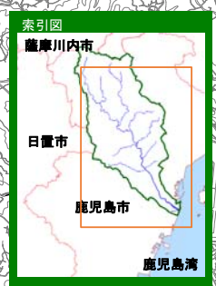
甲突川水系甲突川 【浸水継続時間】