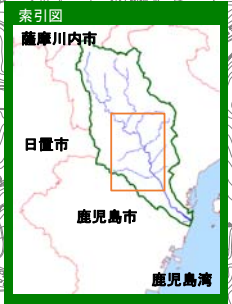
甲突川水系甲突川 【想定最大規模】

1 説明文 (1) この図は、甲突川水系甲突川の水位周知区間について、水防法の規定により指定された想定し得る最大規模の降雨による洪水浸水想定区域、浸水した場合に想定される水深を表示した図面です。 (2) この洪水浸水想定区域図は、指定時点の甲突川の河道の整備状況を勘案して、想定し得る最大規模の降雨に伴う洪水により甲突川が氾濫した場合の浸水の状況をシミュレーションにより予測したものです。 (3) なお、このシミュレーションの実施にあたっては、支川の決壊による氾濫、シミュレーションの前提となる降雨を超える規模の降雨による氾濫、高潮及び内水による氾濫等を考慮していませんので、この洪水浸水想定区域に指定されていない区域においても浸水が発生する場合や、想定される水深が実際の浸水深と異なる場合があります。 2 基本事項等 (1) 作成主体 鹿児島県 (2) 指定年月日 平成30年2月13日 (3) 告示番号 鹿児島県告示第133号 (4) 指定の根拠法令 水防法（昭和24年法律第193号）第14条第1項 (5) 対象となる水位周知河川 ・ 甲突川水系甲突川（実施区間） 左右岸 鹿児島市郡山町3494番地先の伊良ヶ谷滝から海に至る (6) 指定の前提となる降雨 甲突川流域の12時間の総雨量822mm (7) 関係市町村 鹿児島市