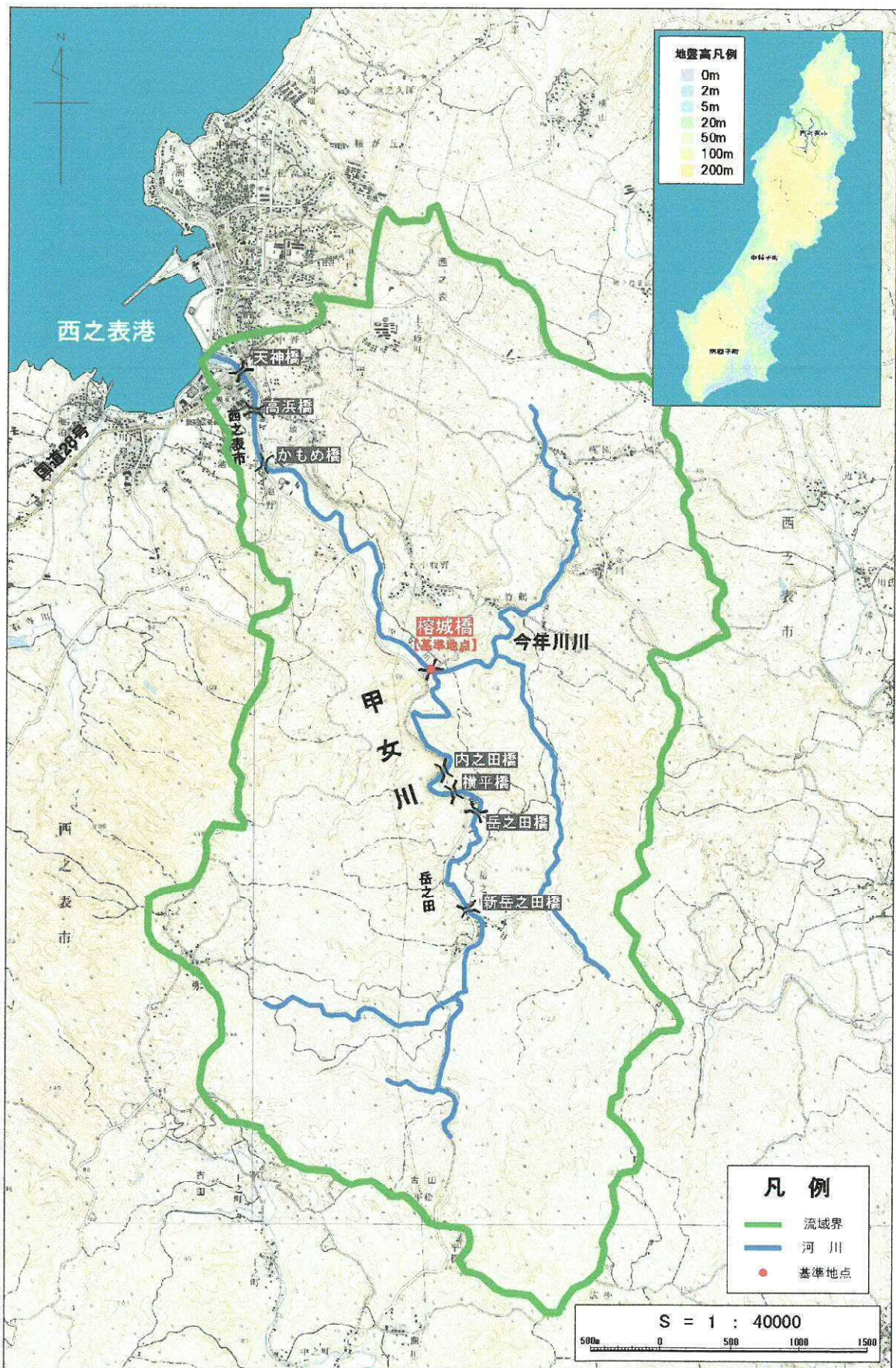
(参考図) 甲女川水系概要図