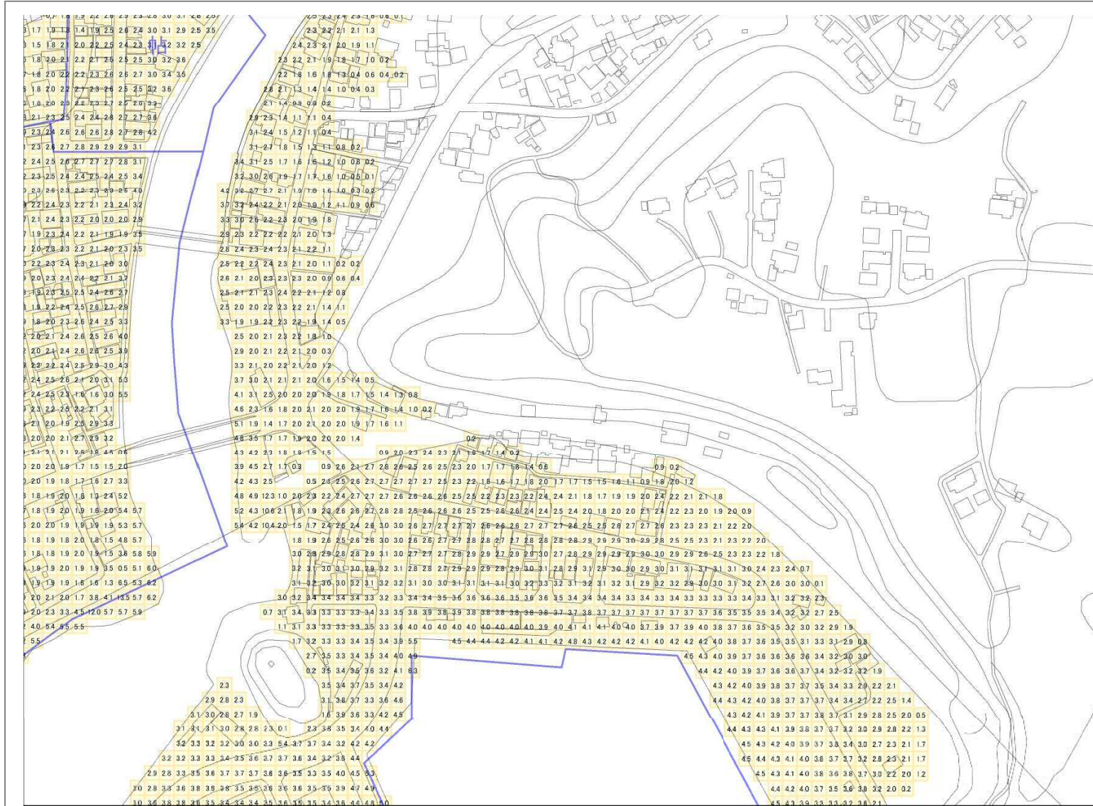
様式-2 津波災害警戒区域 区域図