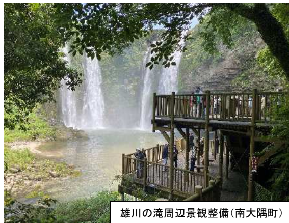
雄川の滝周辺景観整備(南大隅町)