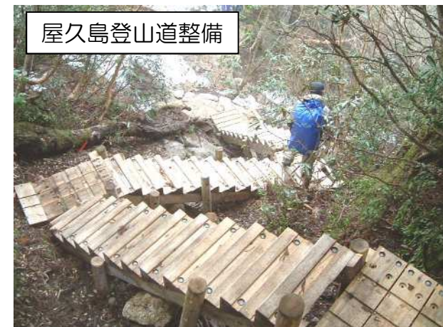
屋久島登山道整備

登山歩道において，老朽化等により損傷した木道等の補修を行い，登山客の安全な利用を図ります。