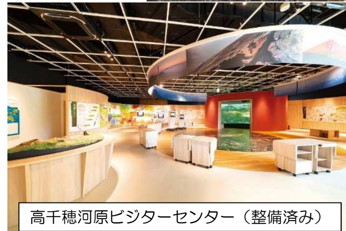
高千穂河原ビジターセンター（整備済み）