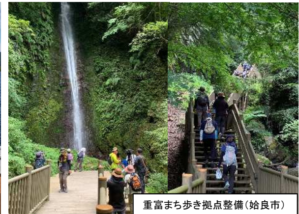
重富まち歩き拠点整備(始良市)