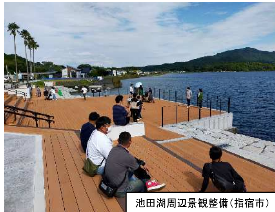
池田湖周辺景観整備(指宿市)