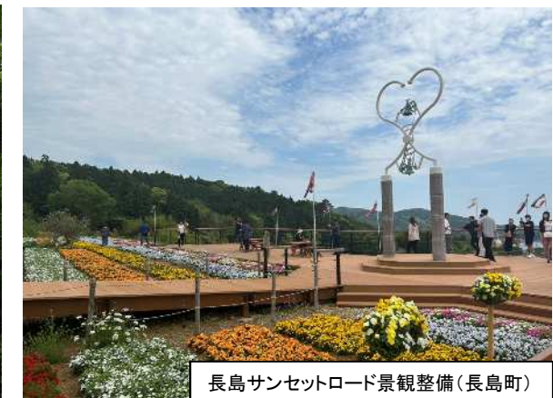
長島サンセットロード景観整備(長島町)