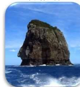
ナポレオン岩 (下甌町)

※効果事例（防災対応） 令和2年9月台風10号の影響により、 下甌島内で断水発生 → 甌大橋を利用し、上甌島から 給水車を派遣