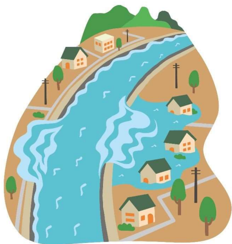
かわ 川 (堤防)