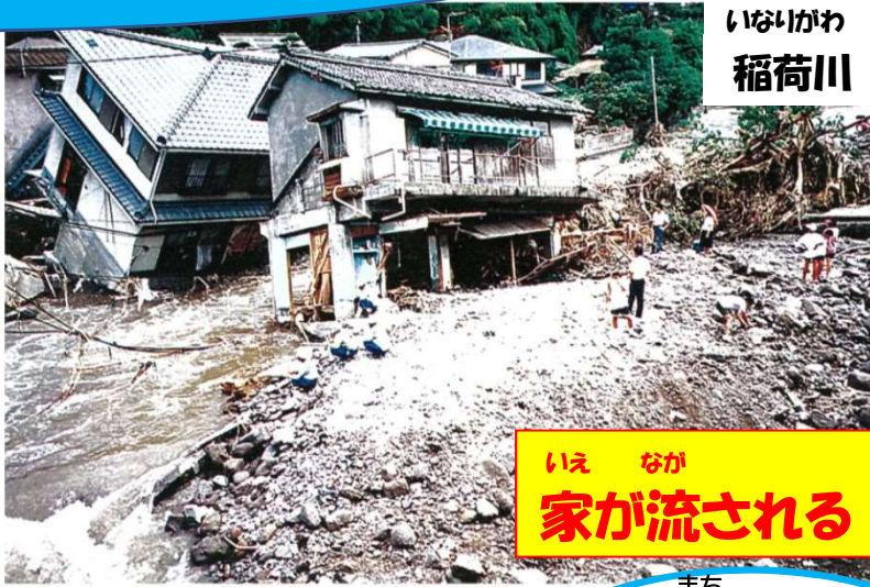
いなりがわ 稲荷川