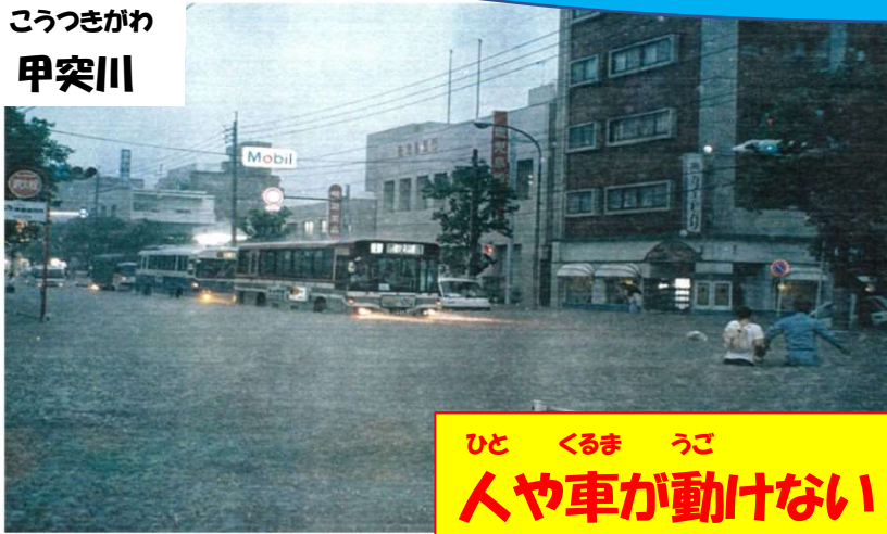
こうつきがわ 甲突川

へいせい ねん がつ か か ご しま し おおあめ 平成5年8月6日 鹿児島市で大雨が