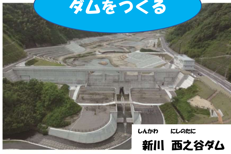
しんかわ にしのたに 新川 西之谷ダム