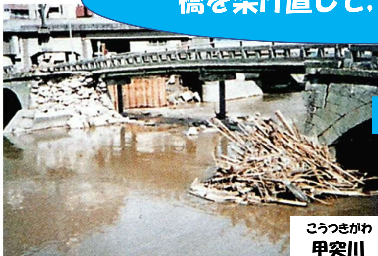
こうつきがわ 甲突川