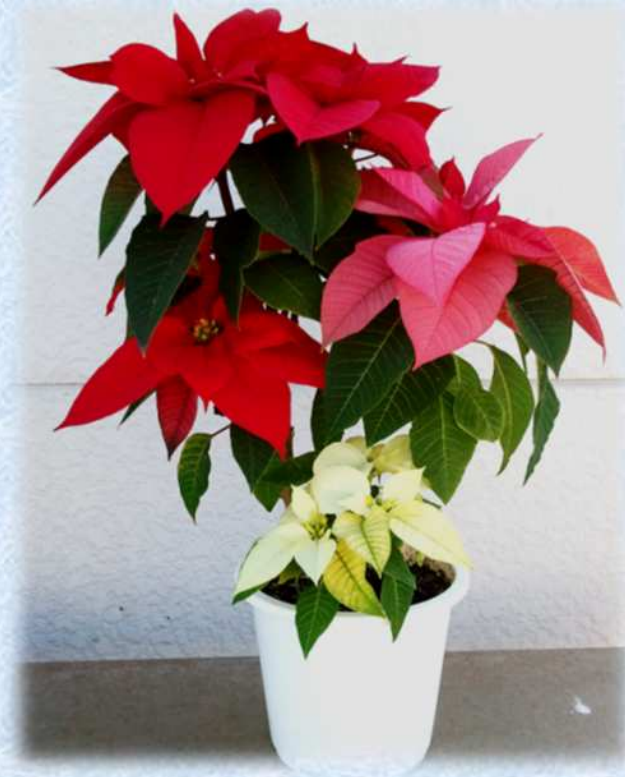
さんさん3色 ポインセチア