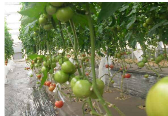
トマト早熟栽培の収穫期の様子