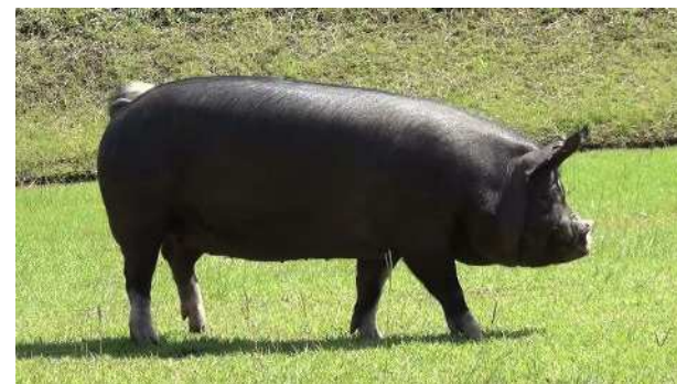
第4系統豚「クロサツマ2015」

第4系統豚と既存の系統豚を交配した3種類のクロス豚を農家が利用することで、斉一性のある肉豚を生産可能