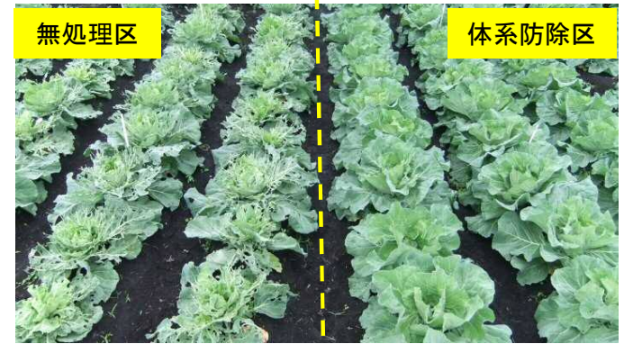
キャベツほ場でのコナガによる被害状況