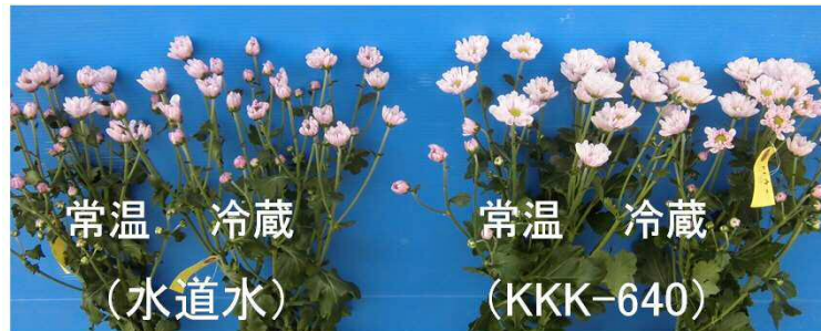
試験開始3日目の状況