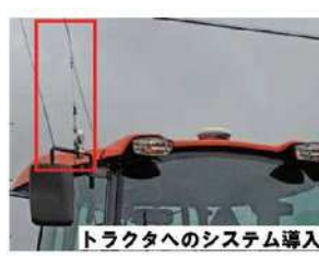
トラクタへのシステム導入