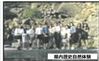
県内歴史自然体験