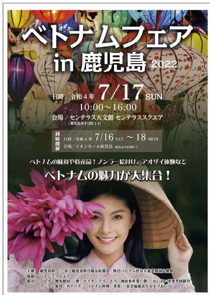
<ベトナムフェア（2022年7月）>

2023年（令和5年）は、日越外交樹立から50周年を迎える記念の年であることから、「日越外交樹立50周年記念イベントin鹿児島」を開催する。