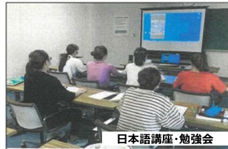
日本語講座・勉強会