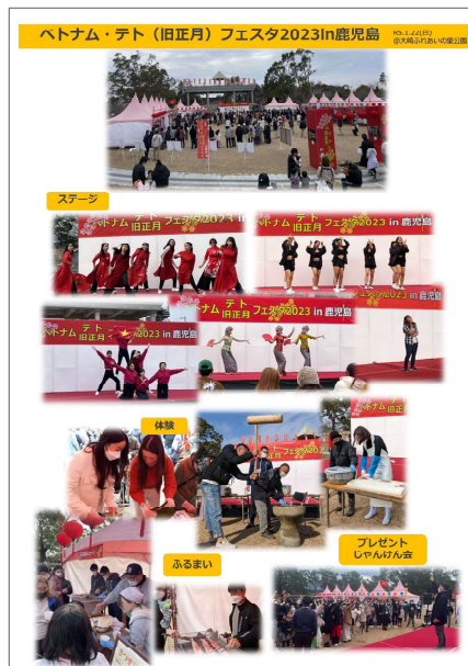
<ベトナムテトフェスタ（2023年1月）>