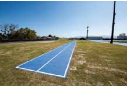
7 傾斜走路(全天候舗装2レーン)