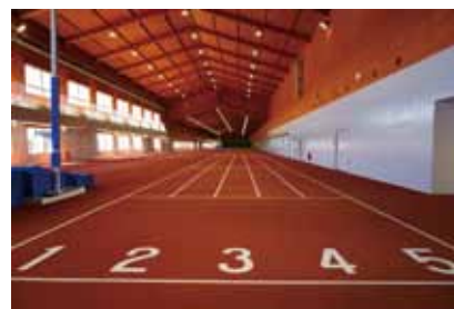
室内競技場 直走路 国内最長150m×5レーンの直走路

【陸上競技場】日本陸連第3種公認陸上競技場(H31.4.1～) / 1周400m×8レーン / 全天候舗装トラック / 天然芝のインフィールド / 傾斜走路(全天候舗装):40m程度×3レーン(異なる傾斜角度) / 夜間照明設備 等