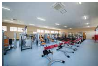
トレーニングルーム フリーウェイトを中心とした機器を配置

【投てき練習場】砲丸投ピット：3箇所 / やり投：2箇所 / ハンマー・円盤投：5箇所