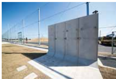
トレーニング用ウォール 投てき種目の補強トレーニング用の壁