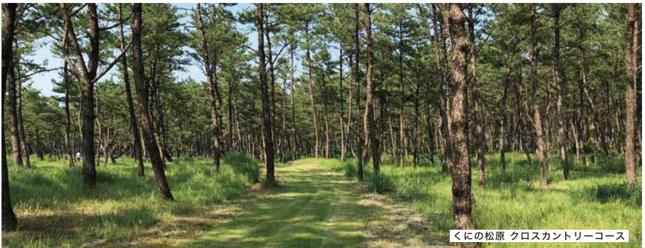
くのに松原 クロスカントリーコース