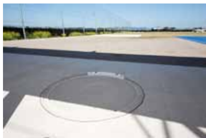
屋根付き投てき場 各投てき競技に対応した設備

トレーニングルームは、フリーウェイトやマシンを使用したトレーニングはもちろん、無酸素パワー測定や体組成等、各種測定にも対応した機器を整備しています。体育館では、アクティブレストとしてバスケットボール、バレーボール、卓球等の実施が可能です。