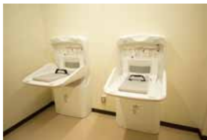
おむつ換えコーナー