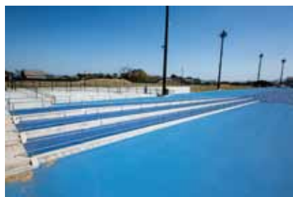
傾斜走路(全天候舗装) 角度の異なる3レーンの傾斜走路

鹿児島県の温暖な気候と、大隅の自然の中に広がる日本陸連第3種公認陸上競技場(H31.4.1～)は、ブルーの全天候舗装の8レーン。近隣の「くにの松原」クロスカントリーコース(1km・2km)と併せて、活用することで、充実した合宿計画を可能にします。また、天候を気にせずトレーニングすることができる室内競技場は、全天候舗装の150m×5レーンの日本陸連公認施設(H31.4.1～)。冷暖房完備の150m直走路は、国内トップクラスで、オールシーズン快適な練習空間を提供します。走幅跳、三段跳、棒高跳にも対応しており、トラック競技、フィールド競技を問わず、トレーニングメニューの可能性が格段に広がります。