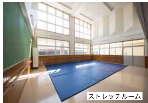
ストレッチルーム