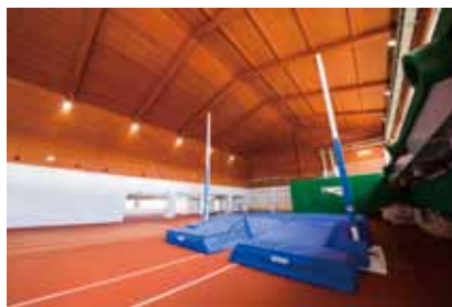
室内競技場 棒高跳 棒高跳びに対応可能な高さ(10m)