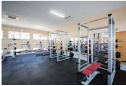
11 トレーニングルーム